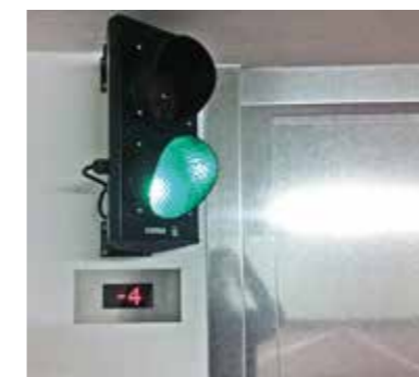
Détail des feux de circulation