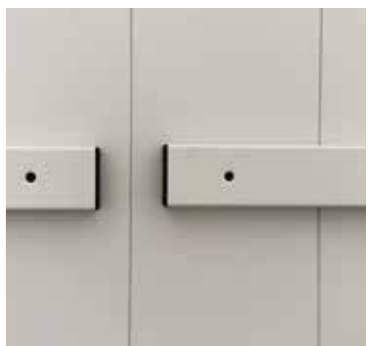
Détails des protections