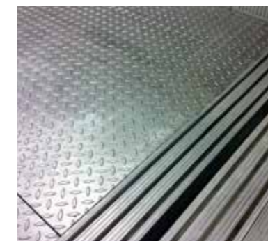
Détail de plancher larmé