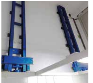
Entraînement avec deux vérins (en option)