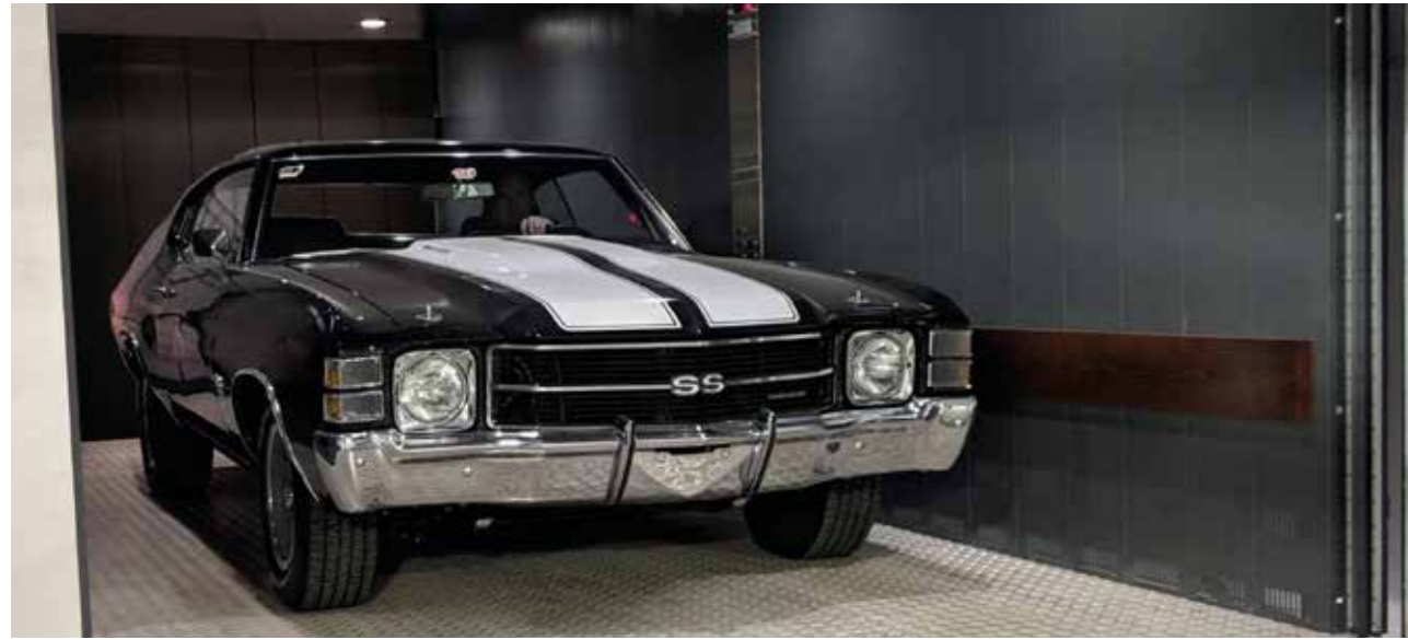
Installation aux USA