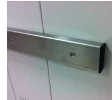
Protections métalliques (en option)