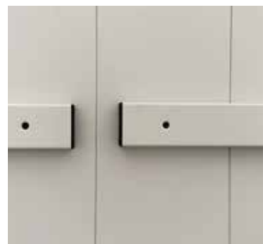
Détails des protections